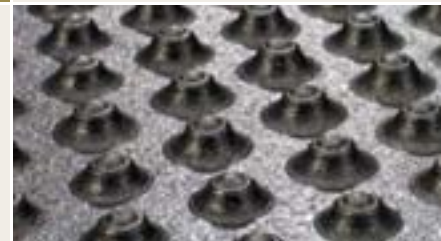
Dubbel opgebouwd noppenprofiel aan onderzijde van de mat